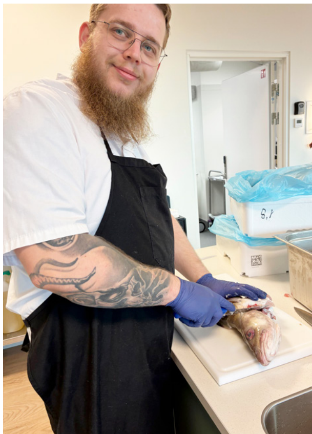
Kokken i gang med at tilberede nytårstorsken.