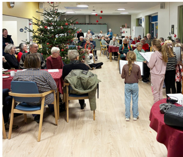
Julekoncert med bes g fra Tornby-Vidstrup Kirkes B rnekor.

P   rets korteste dag, s ndag den 21. december, markerede vi overgangen til lysere tider, da en gruppe frivillige plantede blomsterl g i udeomr derne ved Asbjørn. Blomsterl gene var doneret af St tteforeningen for Friplejehjemmet Asbjørn, Tornby, og vi gl der os allerede til for ret.