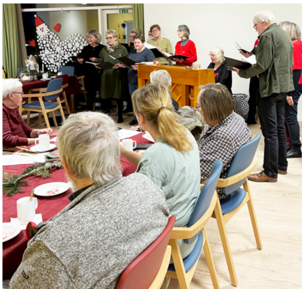
Julekoncert med bes g fra Tornby-Vidstrup Rytmske Kor.

Den 16. oktober blev der afholdt frivilligm de p  Asbjørn, hvor mange lagde vejen forbi. Det var en god eftermiddag med fokus p , hvordan frivillighed kan se ud p  Asbjørn, og der kom mange gode input. Opbakningen var stor, og mange meldte sig som frivillige – noget vi s tter stor pris p . Vi har allerede haft frivillige, der har hjulpet til ved arrangementerne i december, og i l bet af januar og februar vil vi planl gge mere faste tiltag ud fra b de frivilliges og beboeres interesser. Det er en proces at f  de frivillige tiltag godt i gang, og vi takker for alles t lmodighed.