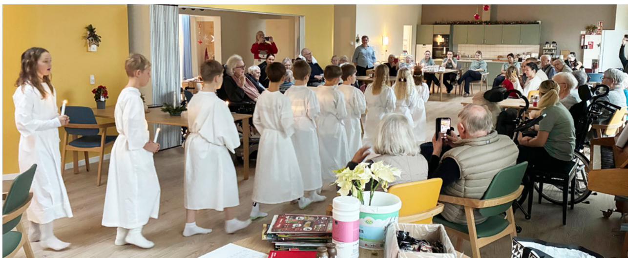
Luciaoptog med 3. klasse fra Skolecenter Hirtshals.