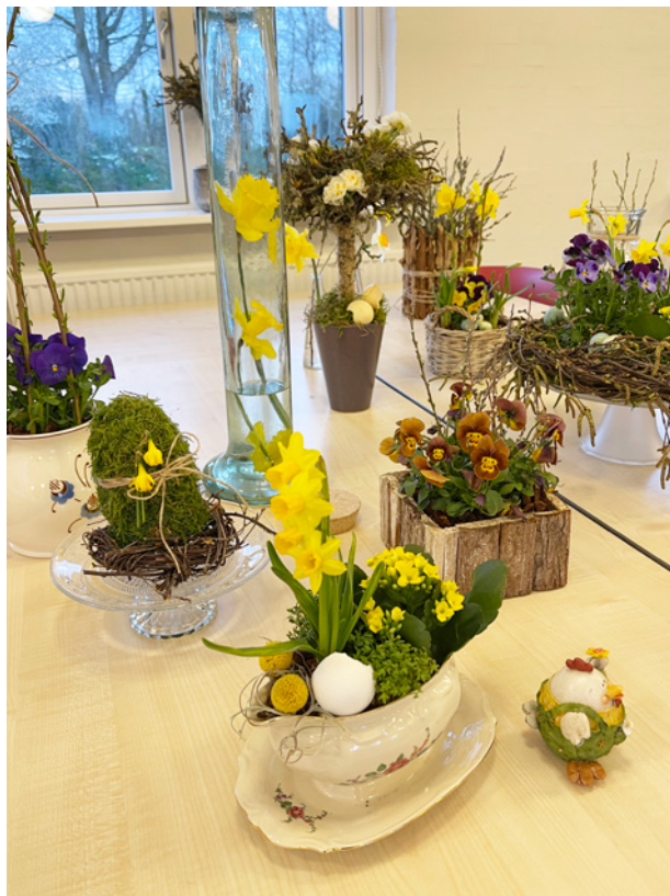
Kreativ Påskehygge i Sognegården.

Der bliver serveret kaffe/te og kage. Alle er velkomne og tilmelding er ikke nødvendig. Det er gratis at deltage.