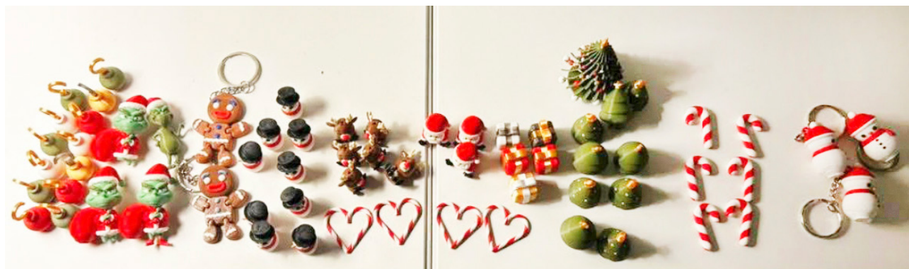
De små figurer som ”Dronen” sætter ud i byen.

Lige nu holder ”Dronen” fri, den er på ferie, siger den, Kommer den igen? – Ja, det må tiden jo vise.