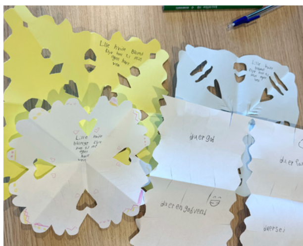
G kkebrevne lavet af 4. T, fra Tornby Skole, som er vores venskabsklasse