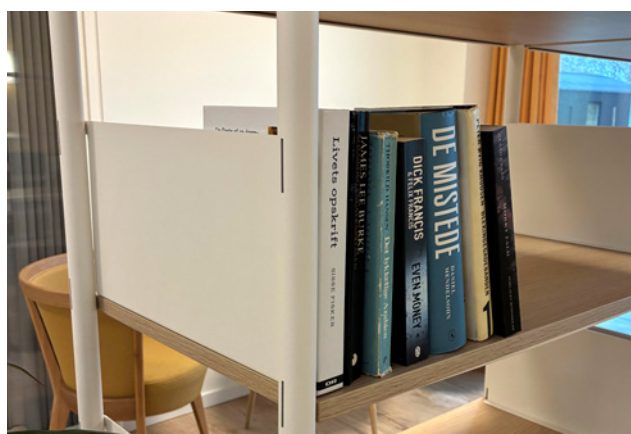
Asbj rns foyer, her kan man bytte b ger efter princippet "Tag  n bog – aflever  n bog".